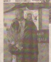
podwyższenia, nakrytego śnieżnobiałym obrusem. Gratulujemy pomysłu i inwencji twórcej!

niewielki samochód dostawczy z otwartą przyczepą. Auto było wspaniale przybrane kwiatami, zieleni i kłosami ziół, a mieszkańcy licznych pasażerów tworzyli krąg wokół honorowego