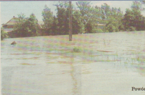
Powódź 1997 r.